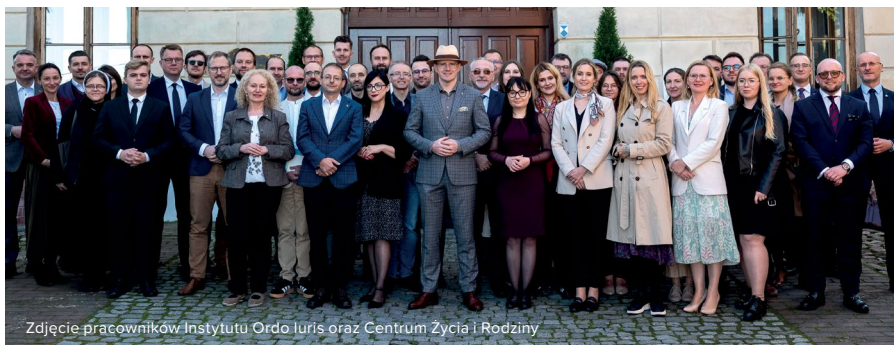
Zdjęcie pracowników Instytutu Ordo Iuris oraz Centrum Życia i Rodziny

Możecie napisać do nas na adres: kontakt@mecenasdlamaluszka.pl . To do niczego Was nie zobowiązuje, a może przynieść cenną pomoc. Czekamy na Wasze pytania i zachęcamy do kontaktu.